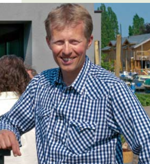
vereniging Hillegersberg en franchisenemer van