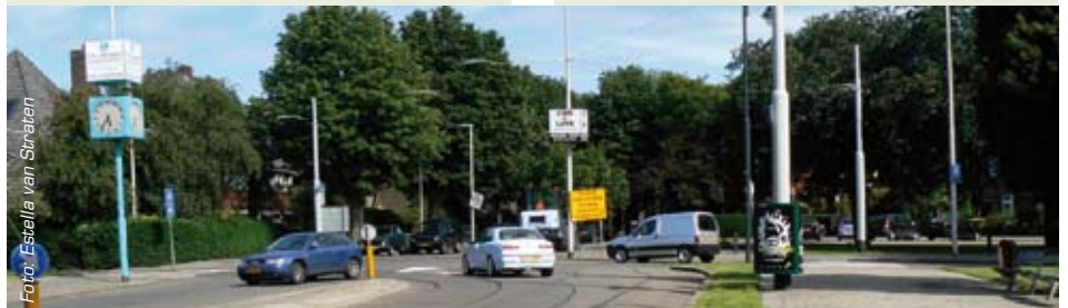
De inmiddels verdwenen straatklok (of stadsklok) op de kruising van de Burgemeester Le Fèvre de Montignylaan en de Burgemeester van Kempensingel.

'En die komen terug. Maar wanneer? Dat is nog niet bekend. CityTec is in overleg met de Dienst Stedebouw+Volkshuisvesting (dS+V) over het ontwerp van de klok. Daar is tot nu toe nog geen beslissing over gevallen.'