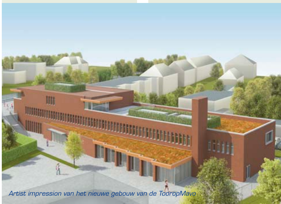
Artist impression van het nieuwe gebouw van de TooropMavo

Quick Response codes scant u met een smartphone of webcam, waarna u terechtkomt bij aanvullende online toepassingen. Via bovenstaande QR-code kunt u meer lezen over de TooropMavo.