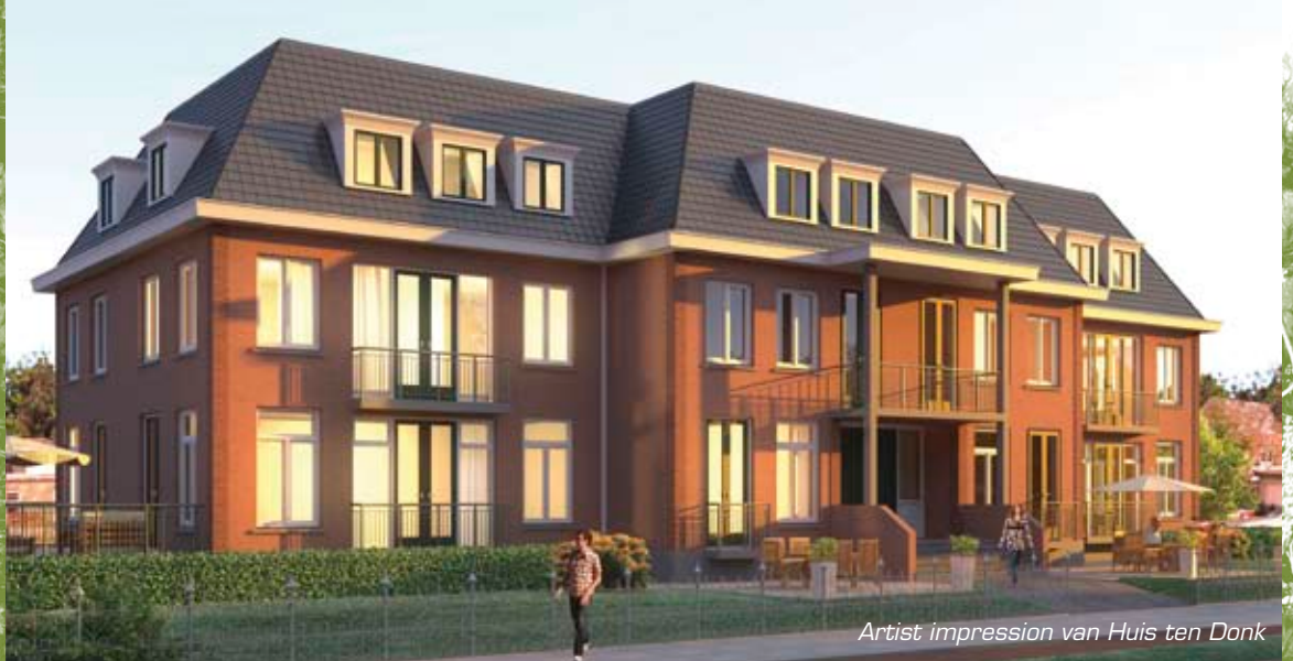
Artist impression van Huis ten Donk

Al jaren biedt de binnenkomst in het Molenlaankwartier, komend vanuit het zuiden, over de Irenebrug, een bedroevende aanblik, die bepaald niet representatief genoemd kon worden voor de rest van de wijk. Aan linkerkant bevond zich op de hoek van de Molenlaan en de Terbregse Rechter Rottekade een bloemenwinkel, gevestigd in een bouwvallig onderkomen van golfplaten en rietschermen. Aan de rechterzijde, in de bocht van de Rotte, een braakliggend terrein in gebruik als openluchtshowroom voor tweedehands auto's.