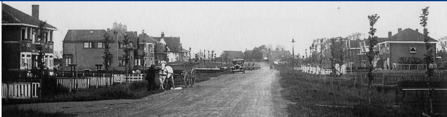
De Molenlaan in 1929: een zandweg, met aan weerskanten sloten en bruggetjes.