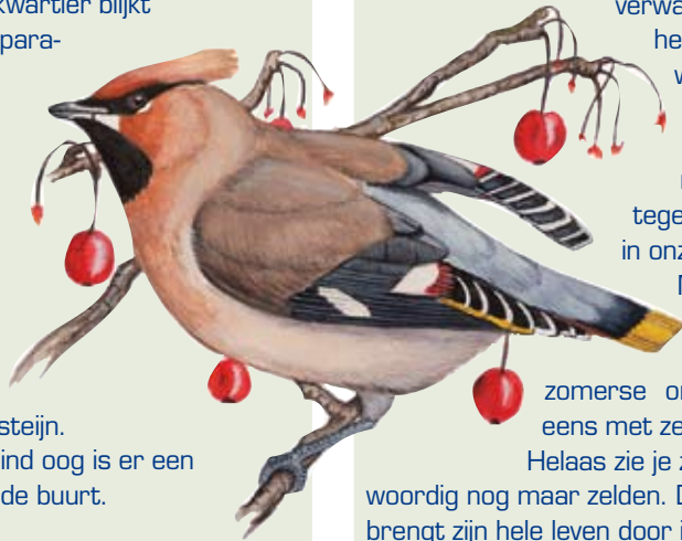
Pestvogel. Illustratie van Jasper de Ruiter, Tringa-Paintings (www.tringa-paintings.nl)

Het Molenaankwartier blijkt een waar vogelparadijs. De sijs, koolmees en merel blijken talrijke buren. Een verrassing was een grote groep groenlingen die huis houdt aan de rand van Duivesteijn. Voor een getraind oog is er een hoop te zien in de buurt.